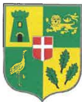
Commune de Barberaz Savoie