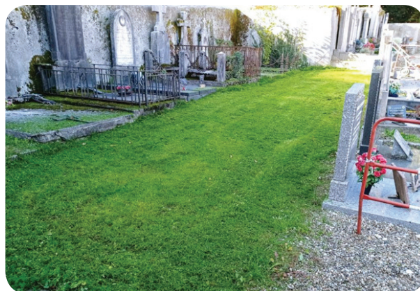
Végétalisation des allées en cours

Identifiés avec les noms des défunts, ils seront ensuite déposés à perpétuité dans l'ossuaire communal qui sera prochainement rénové et ce, dans les conditions de respect et de dignité des défunts.